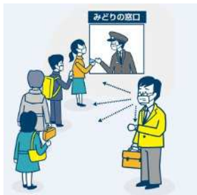
窓口でのきっぷのお受取り不要