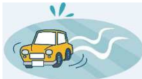
冬の長距離運転は不安