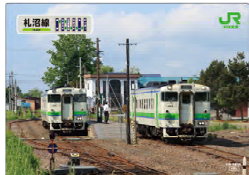
クリアファイル「うら面」