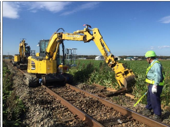
写真2. 釧網線 清里町駅～中斜里駅 間