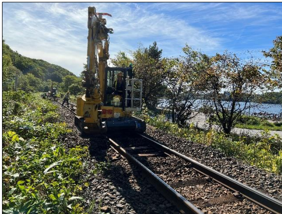
写真1. 石北線 呼人駅～網走駅 間