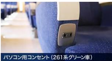
パソコン用コンセント(261系グリーン車)