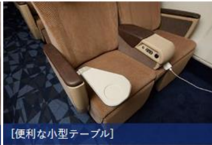
[便利な小型テーブル]

大型座席背面テーブルで、移動中のパソコン作業も快適です。肘掛け収納型の小型テーブルもくつろいだ姿勢のままお使いいただけます。