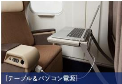
[テーブル&パソコン電源]