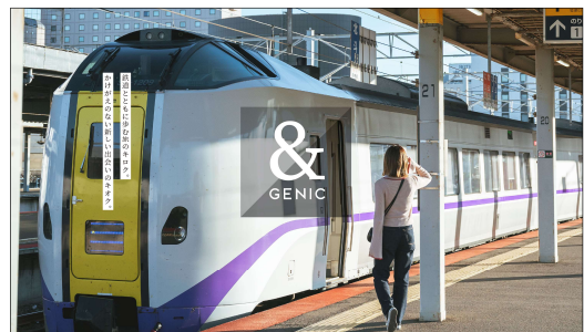
【特設サイト】(イメージ)