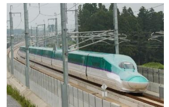
北海道新幹線 はやぶさ (H5)