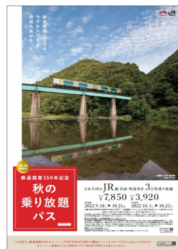
「鉄道開業150年記念 秋の乗り放題パス」ポスター

※STATION STAMPの対象駅は、WEBアプリ「TRAIN TRIP」からSTATION STAMP内の「よくあるご質問」でご確認いただけます。