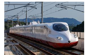
西九州新幹線 かもめ