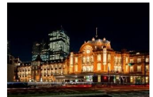
東京ステーションホテル（外観夜景）