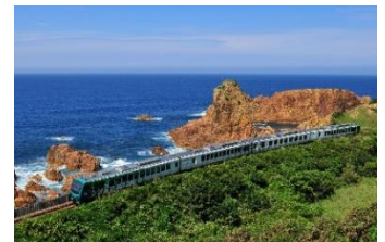
リゾートしらかみ