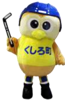
ガッホくん(釧路町)