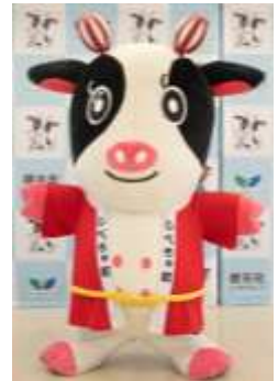
ミルクックさん(標茶町)