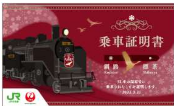
乗車証明書 おもて面