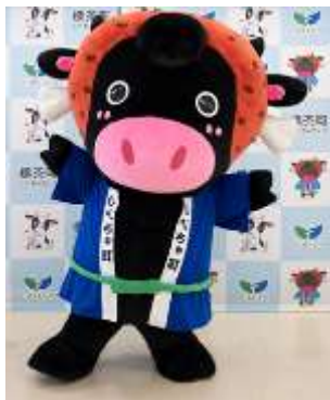
ハッピーくろべえ(標茶町)