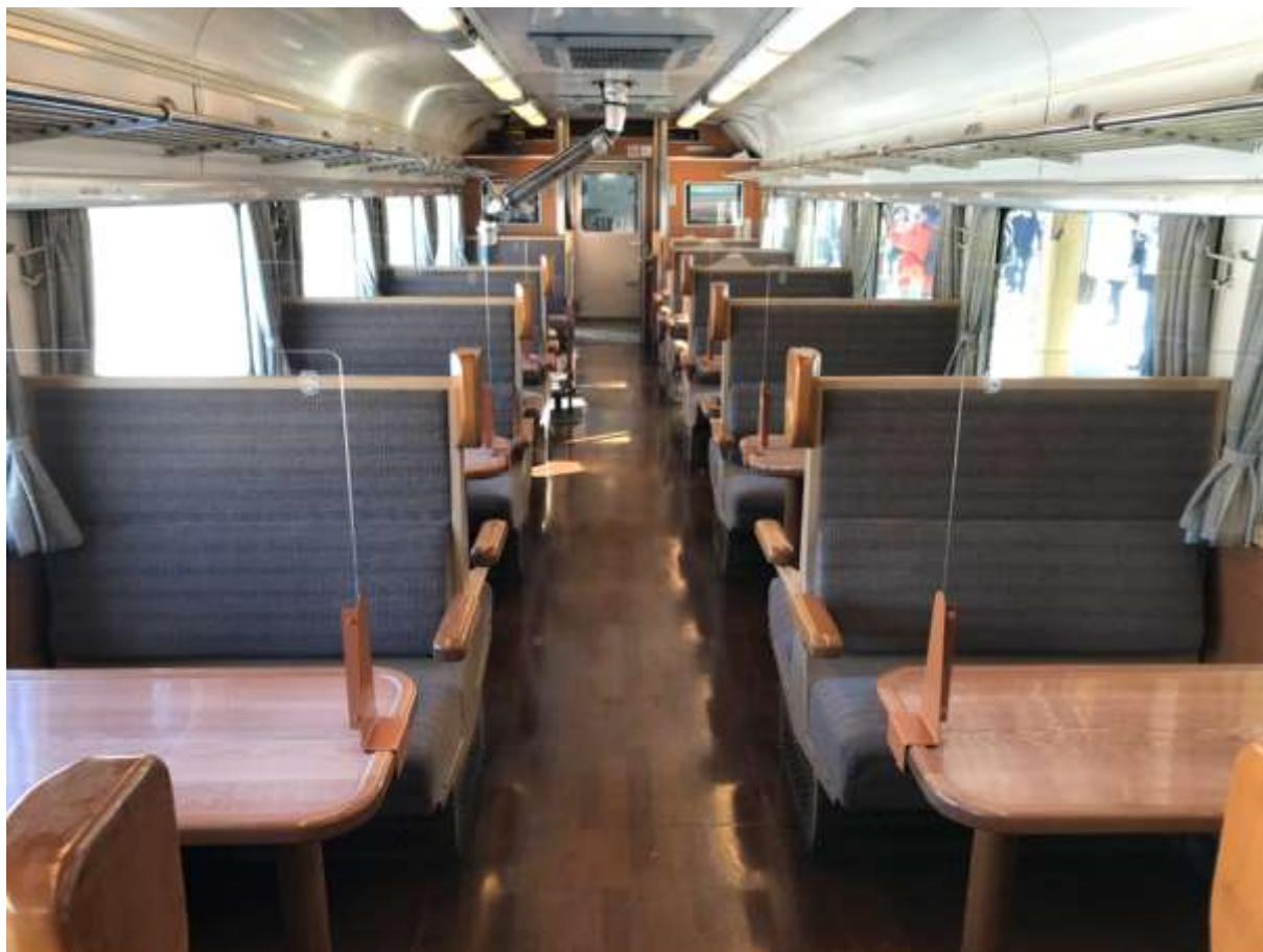
(クリアパーテーション設置)