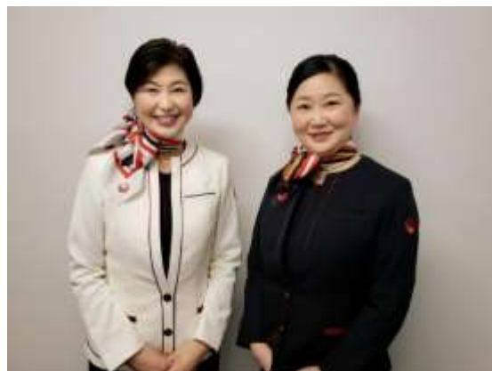
JALふるさとアンバサダー ※撮影時のみマスクを外しています