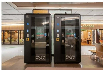
▲ STATION BOOTH仙台(新幹線改札内)