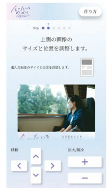
ポスターメーカー（イメージ）

Step3：ハッシュタグ「#会いたいをのせて」「#ゆけ新幹線」を付けて、オリジナルポスターを投稿。