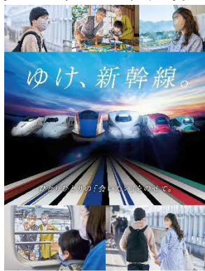
ポスター（イメージ）

スペシャルムービーはJRグループ Twitter 公式アカウントやYouTubeでもご紹介しますので、是非ご覧ください！