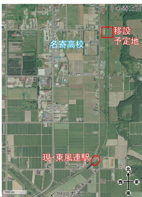
現在の東風連駅と移設予定地