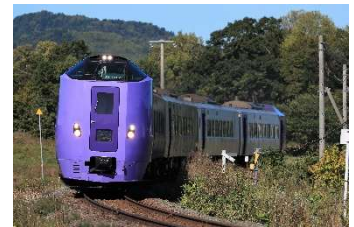
フラノラベンダーエクスプレス

「フラノラベンダーエクスプレス」は261系5000代「ラベンダー編成」を使用して運転しております。「ラベンダー編成」は、北海道と国の支援を受け、北海道高速鉄道開発株式会社が所有し、当社は無償貸与を受けております。支援に感謝を申し上げます。