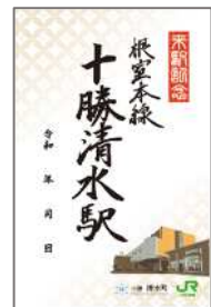
十勝清水駅鉄旅印