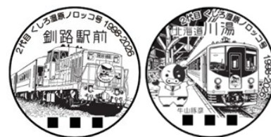
〈限定小型印の一例〉

(釧路駅) フィッシャーマンズワープ郵便局・釧路駅前郵便局・塘路郵便局 (川湯温泉駅) 標茶郵便局・弟子屈郵便局・川湯郵便局