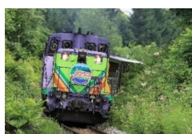
▲ラベンダー色の機関車