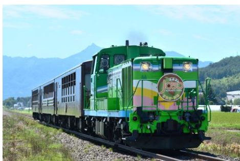
【富良野・美瑛ノロッコ号】