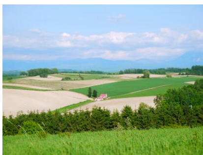
【美しい丘陵風景（車窓）】