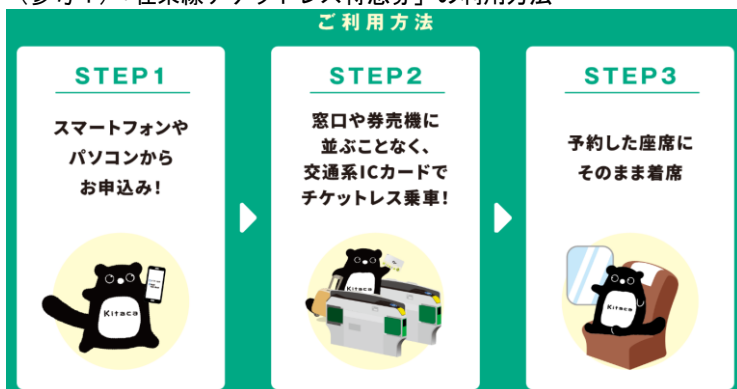
(参考1) 「在来線チケットレス特急券」の利用方法