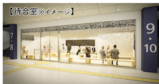
待合室はカマクラをモチーフにデザイン