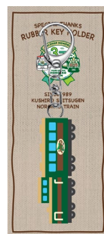
くしろ湿原ノロッコ号 ラバーキーホルダー 900 円