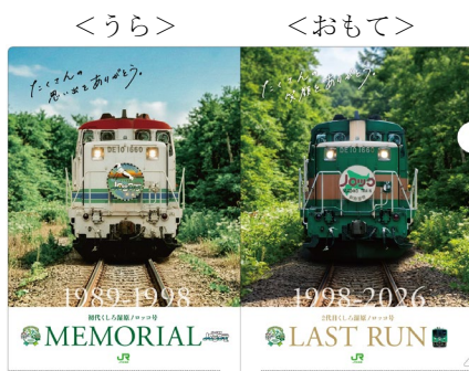
くしろ湿原ノロッコ号 メモリアルクリアファイル 400 円