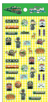
くしろ湿原ノロッコ号 シールセット 800 円