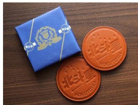
「鞆いたがき」製作「北斗星 革製コースター」

※復刻版「北斗星 革製コースター」は該当プラン1室につき1箱（2枚一組）進呈します。 「北斗星」ヘッドマークをデザインし、使い込むほど味わいが出るタンニンなめし革を使った「鞆いたがき」製作のコースターを、当時販売していたデザインのまま、蘇らせました。（「北斗星」車内で販売していた北斗星グッズ用包装紙でラッピングした化粧箱入り）