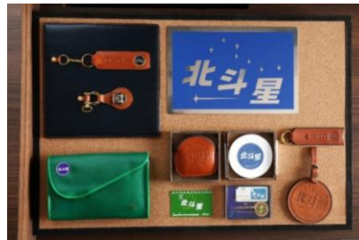
⑥当時車内で販売されていたエンブレム キーホルダーの復刻品等を収めた 「北斗星コレクションケース」