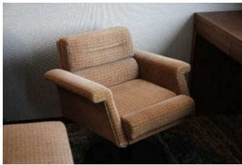
②A個室寝台「ロイヤル」の チェア