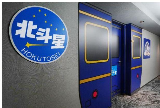
「北斗星コレクションルーム」入口ドア

本コレクションルームは、1988年（昭和63年）3月から27年間、上野～札幌間を結ぶ寝台特急として多くの鉄道ファンに愛された「北斗星」をテーマにした客室です。多様な個室寝台や食堂車を連結した豪華寝台特急として運行した「北斗星」。今回、新設する『北斗星コレクションルーム』は、その貴重な鉄道部品の数々をインテリアとして使用し、「北斗星」の動画や同列車で実際に使用していた浴衣（復刻版）を用意するなど、往時の鉄道車両の魅力を1室に詰め込んだこだわりの空間です。