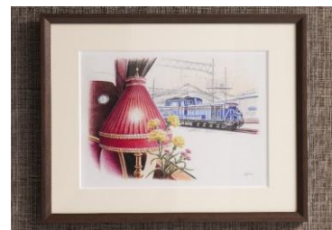
⑨イラストレーター鈴木周作氏の 水彩色鉛筆画パネル