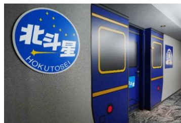
①客室入口に「北斗星」の ヘッドマーク・エンブレム