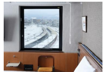
⑧トレインビューを楽しめる 位置に折り畳みいすとミニ テーブル