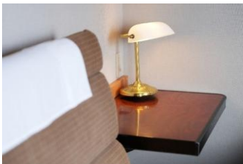
②A個室寝台「ロイヤル」の ソファベッド、 食堂車「グランシャリオ」の テーブル照明