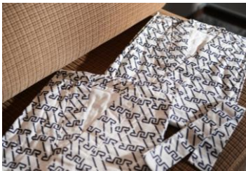
③実際に使用されていた 浴衣（復刻版）を貸与