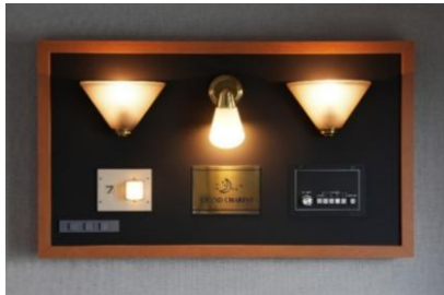
④各車両で使用されていた備品を 1つのパネルに集めた 「北斗星コレクションボード」