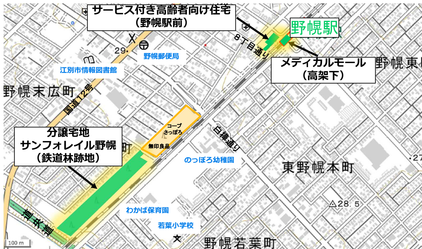
【野幌駅周辺で進行中の3つの開発】

また、「サンフォレイル野幌」では現在販売中の1工区に続き、本年1月5日より2工区の販売も開始しましたので、合わせてお知らせいたします。