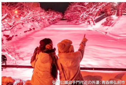
弘前公園追手門付近の外濠：青森県弘前市

本州最北端・青森県と 津軽海峡を越えた北海道道南エリア 2つのエリアの冬が織りなす 美しい世界を旅してみませんか？