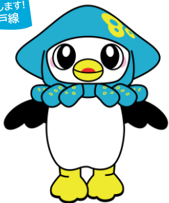
青森県八戸市 マスコットキャラクター 「いかずきんズ」