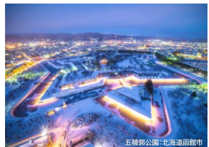
五稜郭公園：北海道函館市