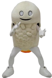
北海道北斗市 公式キャラクター 「ずーしーほっきー」