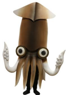
北海道函館市 観光キャラクター 「イカール星人」 ©山猫山