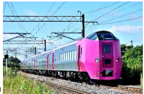
臨時特急『雪のはまなす号』（イメージ写真）