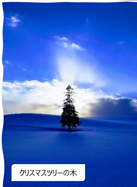
クリスマスツリーの木