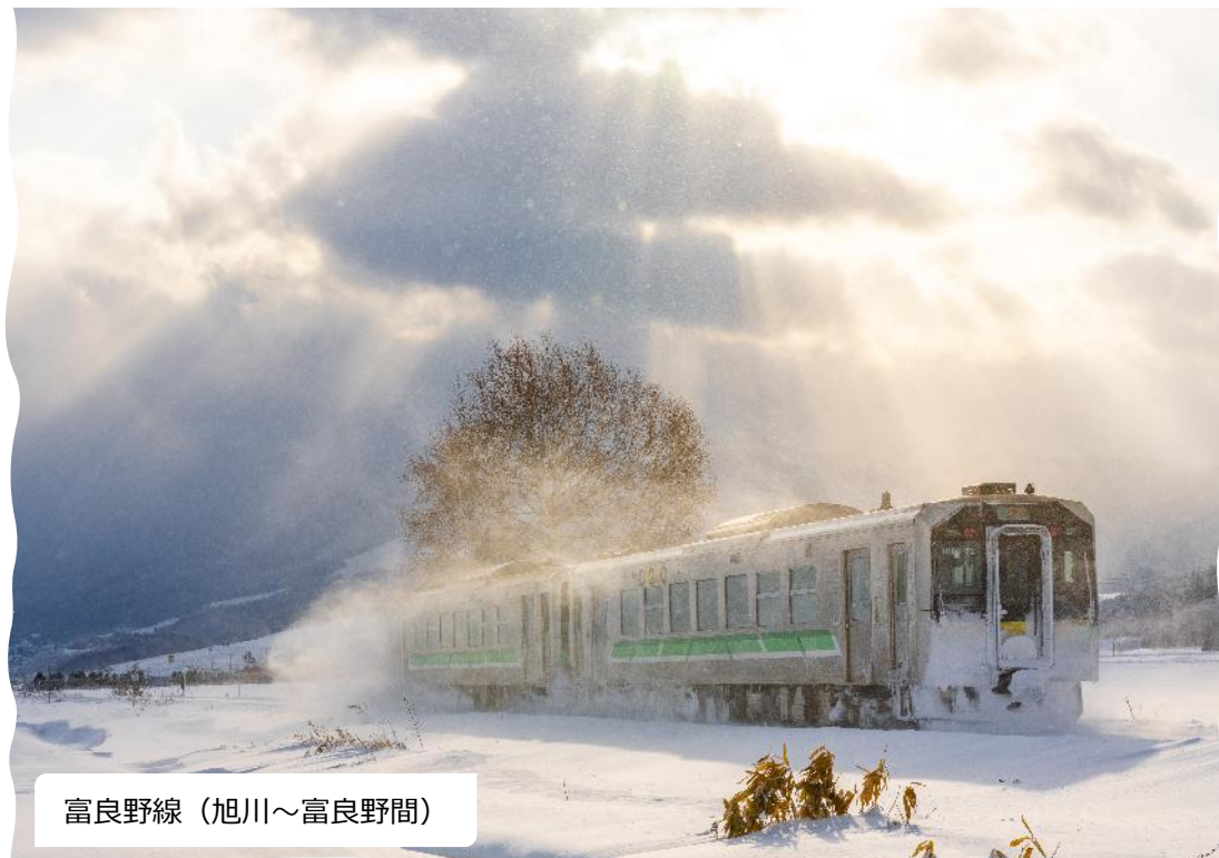
富良野線（旭川～富良野間）