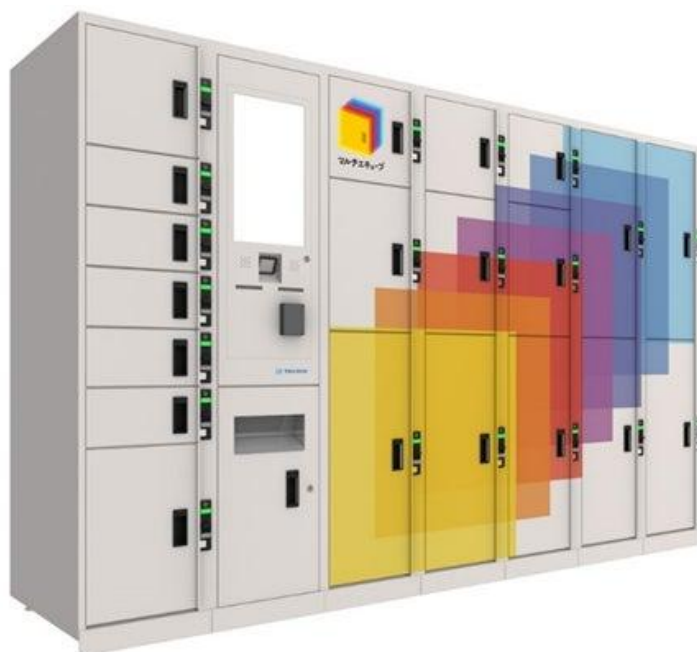
（マルチエキューブ※画像はイメージです）