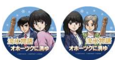
ヘッドマーク イメージ

1980年代に登場し、ひがし北海道を舞台としたTVゲーム「オホーツクに消ゆ」と「流水物語号」がコラボし、オリジナルヘッドマークやサボ等を装着して運行します。