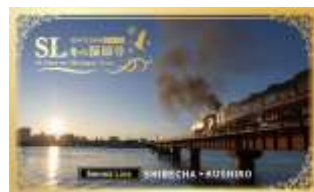
乗車証明書（イメージ）

上下で異なるデザインの乗車証明書を、ご乗車の皆様全員にプレゼントします！標茶町観光協会主催の「SL冬の湿原号フォトコンテスト2025」で「JR賞」を受賞した作品がデザインされています。