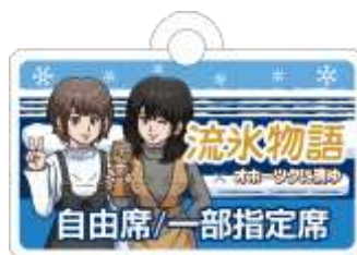
エンブレム イメージ