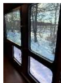
展望通路の大型窓