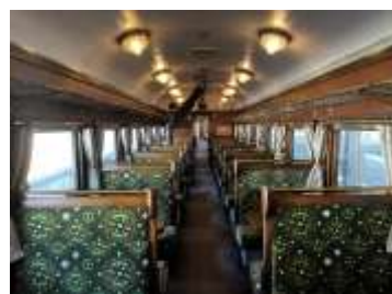
「カフェカー」室内とダルマストーブ