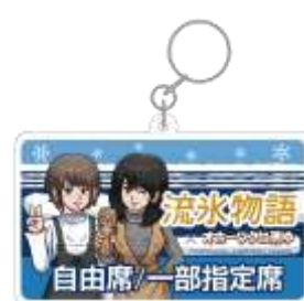
キーホルダー イメージ