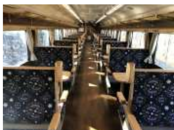
「ストープカー」室内