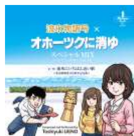
レコード イメージ