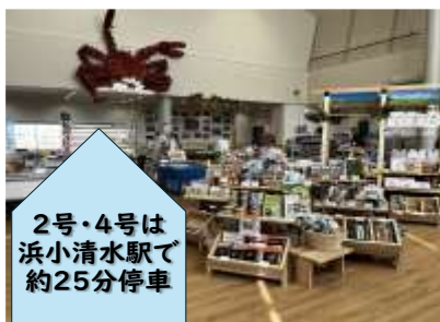
道の駅「はなやか（葉菜野花）小清水」