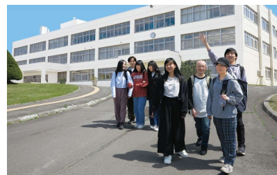
北海道追分高等学校

また、「北海道ニセコ高等学校」「北海道富良野緑峰高等学校(※)」2校が考案したコースも昨年に引き続きご用意しております。