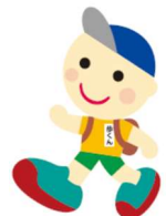
イメージキャラクター「歩くん」

JR北海道の駅を中心に、健康増進を目的とするウォーキングイベントです。例年春から秋にかけて、土・日・祝に開催する「イベントウォーク」、開催期間中お好きな日に参加できる「いつでもウォーク」を実施しています。両ウォークともに、予約なし、無料で参加できます。