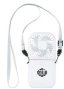
炭鉄港ハンディファンイメージ