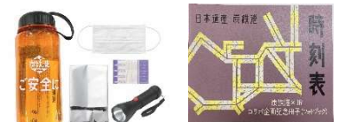
炭鉄港防災ボトルセット&オリジナル記念冊子イメージ