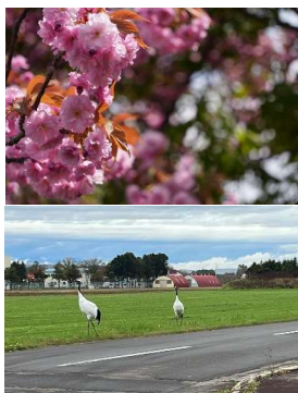
※ウォーキング参加のお客様からの投稿写真です。