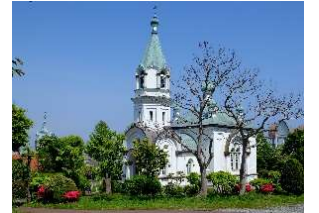
函館ハリストス正教会

イベントウォーク 9月20日(土)【盛岡駅】 11月2日(日)【青森駅】 (両コース 5POINT)