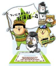
(ステッカー・アクリルスタンド)