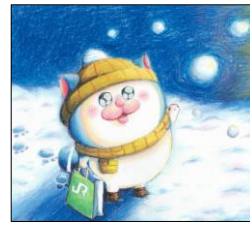
(描きおろしイラスト)