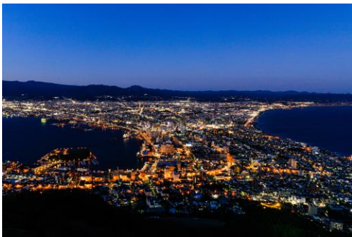
写真:函館山からの夜景