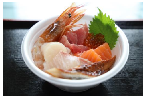
写真:海の幸 (イメージ)