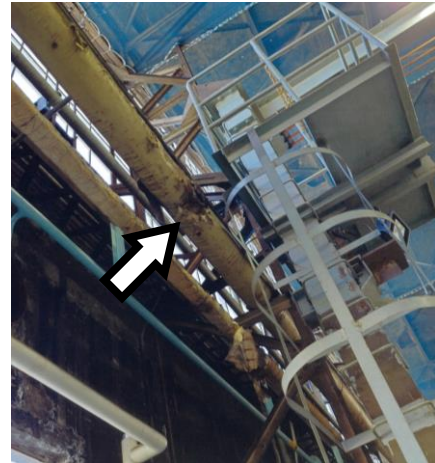
左：施設内蒸気管保温材の位置、右：保温材の剥離状態