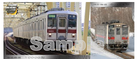
△商品デザイン（抜粋）