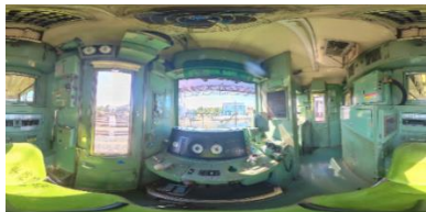
△廃車となった「9101編成」がNFTアイテムになり、あなたのもとに！ 360度VR画像やドローン空撮動画、デジタル電車カード等発売中！