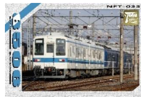
△「8000系特集」 デジタル電車カード発売中！