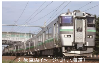
対象車両イメージ(JR 北海道)