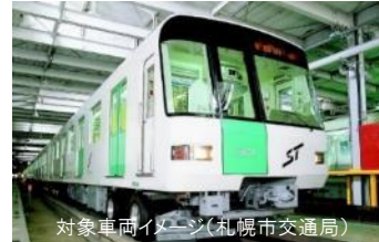
対象車両イメージ(札幌市交通局)