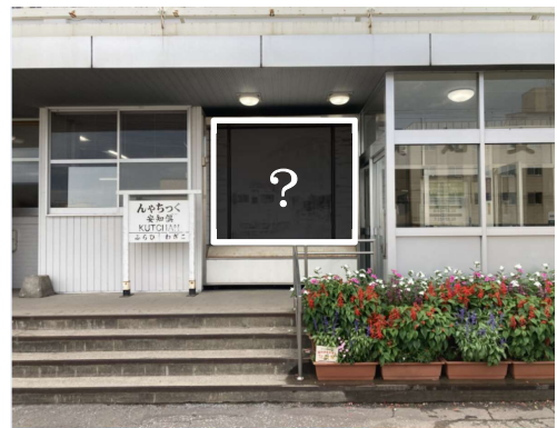
J R 倶知安駅待合室出入口付近