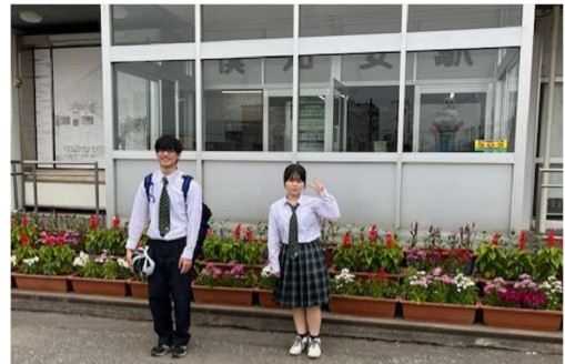
北海道倶知安農業高等学校