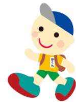
イメージキャラクター「歩くん」

JR北海道の駅を中心に、健康増進を目的とするウォーキングイベントです。例年春から秋にかけて、土・日・祝に開催する「イベントウォーク」、開催期間中お好きな日に参加できる「いつでもウォーク」を実施しています。両ウォークともに、予約なし、参加無料で参加できます。