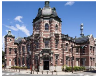
岩手銀行赤レンガ館

弘前と同じく「駅からハイキング&ウォーキングイベント」と共同開催。初開催のNEWコース！盛岡駅周辺の見どころを網羅したウォーキングコース！盛岡八幡宮や盛岡城跡公園といった古き良き日本文化や、歴史をたどるウォーキングをお楽しみください。