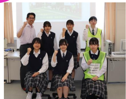
北海道富良野緑峰高等学校 総合ビジネス学科3年生のみなさん

「北海道富良野緑峰高等学校」総合ビジネス学科3年生考案コース！「富良野を好きになってほしい」という想いを込めてコースを作成しました。期間中、コース中の施設で開催されるイベント「ふらのワインぶどう祭り」（9/1 ふらのワイン工場）では、富良野緑峰高校商業クラブと、ふらのジャム園が共同開発した「富良野トマトパテ」を現地で販売します。