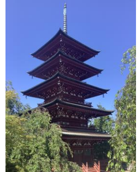
さいしょういん ごじゅうのとう 最勝院 五重塔