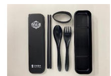
炭鉄港カトラリーセットイメージ