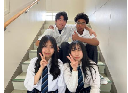
北海道ニセコ高等学校 グローバル観光コース3年生のみなさん

「北海道ニセコ高等学校」のグローバル観光コース3年生が考案したコース！雄大な自然に囲まれたニセコ町。高校生たちが自らの足で下見を行いながら、ニセコ町の自然を生かした持続可能な観光（サステナブル）をテーマにコースを作成しました。地元の高校生が知る羊蹄山の絶景ポイントや、たくさんの人に知ってほしいおすすめスポットをコースに盛り込みました。ぜひニセコへお越しください。特急ニセコ号でもおもてなしを実施します！