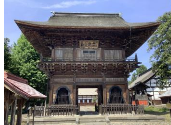
ぜんりんが い ちようしょうじ 禅林街 長勝寺

JR東日本「駅からハイキング&ウォーキングイベント」と共同開催。2023年度から2回目の開催となる弘前ウォーク。2023年度は春の弘前、2024年度は一味違った秋の弘前城下町をお楽しみください。