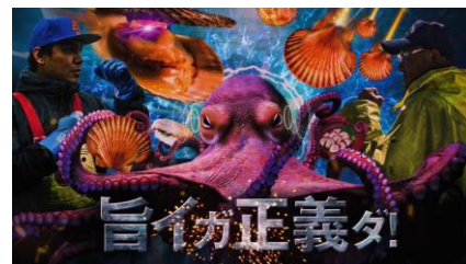
インタビュー動画