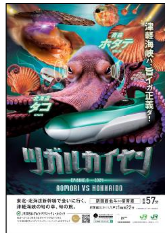
ポスタービジュアル