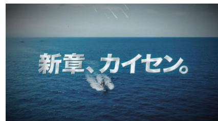
プロモーション動画