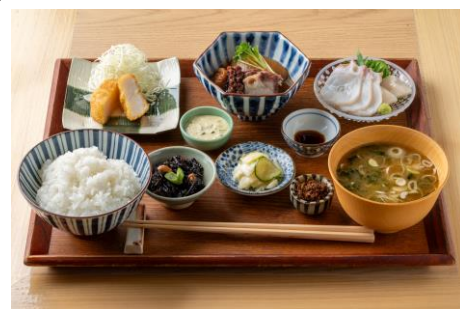
青森産ホタテと函館産タコの競演! ツガルカイセン定食