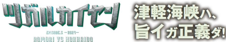
新しいキャンペーンロゴ・メッセージ

また札幌駅では5月下旬（予定）より東西連絡通路での装飾も実施します。インパクトある対決の様子をお楽しみください。