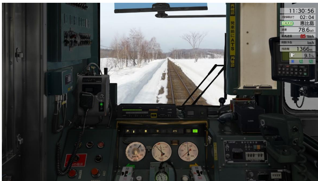
留萌本線 DLC プレイ画面（イメージ）

JR 東日本の運転士が実際に使用する訓練用シミュレータを一部加工し、ご家庭用に配信しているものです。走行する車両にて収録した高画質の映像と走行音により、リアルな運転操作を体験できます。