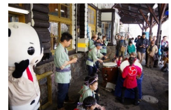
川湯ばやし(過去実施時の様子)

※運転時刻等につきましては、弊社ホームページ「くしろ湿原ノロッコ号特設ページ」をご覧ください。