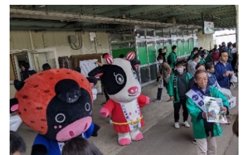
お出迎え(6月実施時)

標茶駅1番ホームにて、「上り」のくしろ湿原ノロッコ号到着時に標茶町の皆さまとご当地キャラクターによるお出迎え・お見送りやノベルティ配布、地域の特産品販売を行います。