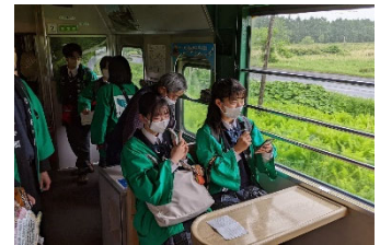
高校生ガイド(6月実施時)

「上り」のくしろ湿原ノロッコ号の塘路駅～標茶駅間において、標茶高校の生徒による観光ガイドアナウンスを行います。