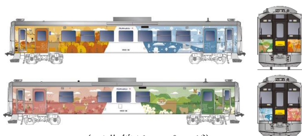
(石北線ラッピング)

(4) 列車の遅延・運休等が発生している場合は、公開を中止させていただく場合があります。