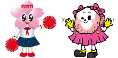
森町観光キャラクター さくりん