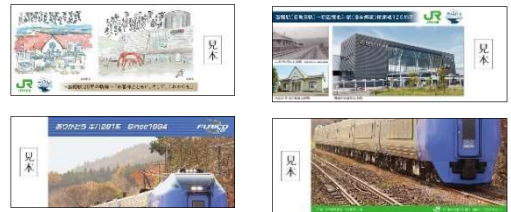
▲函館駅（函館→新函館北斗） ▲新函館北斗駅（新函館北斗→函館）