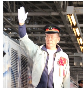
旭山動物園 坂東園長