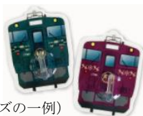
(オリジナルグッズの一例)