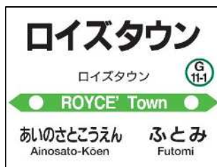
[ロイズタウン駅位置図]

位置： あいの里公園～太美間 駅形式： 1面1線、無人駅 設備： 乗降場、待合、スロープ