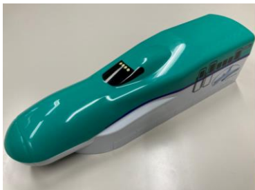
北海道新幹線弁当 お弁当箱