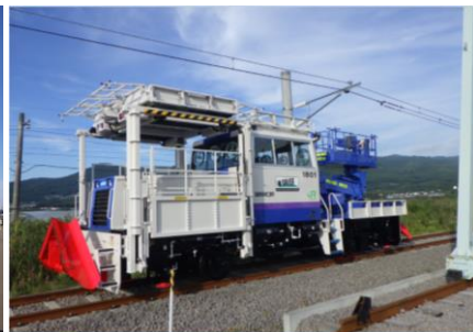
画像は全てイメージです。