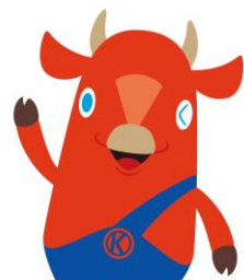
木古内駅 新幹線観光駅長 キーコ