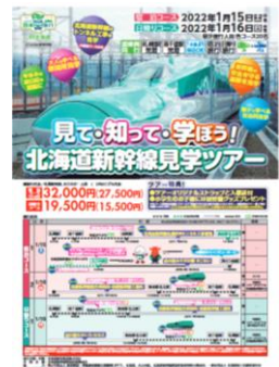
パンフレットイメージ