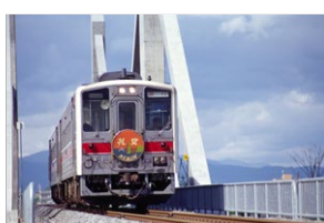
急行札文イメージ