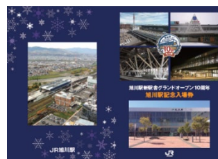
オリジナル記念台紙イメージ

※ 記念入場券をお買い求めいただいたお客様には、「オリジナル記念台紙」をプレゼント！