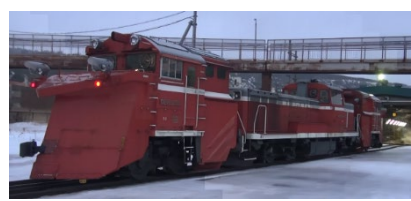
ラッセル車 (DE15形) イメージ