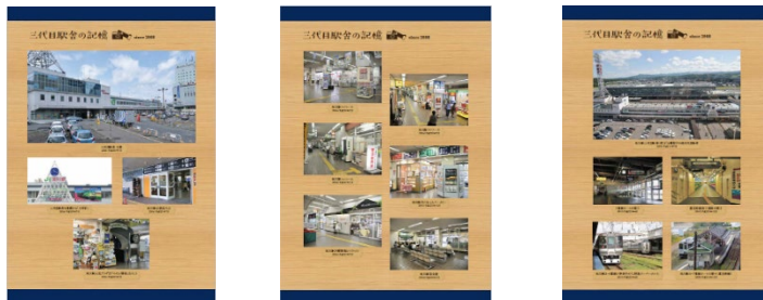
写真パネルイメージ