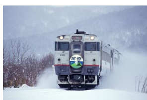
急行宗谷イメージ