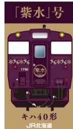
顔出しパネルイメージ