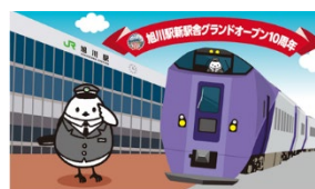
記念パネルイメージ