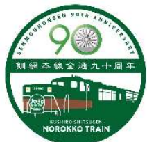
コラボデザイン ヘッドマーク（イメージ）

○装着期間 2021年4月29日（木・祝）から今年度の運転終了まで （夕陽ノロッコ号のヘッドマークは除く）