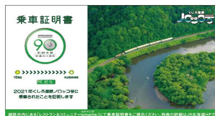
乗車証明書（くだりイメージ）