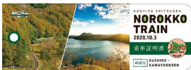
記念乗車証明書のイメージ(上り)

○内 容 ・「 えびいろ よあけ 葡萄色の旦」オリジナルコースターをプレゼント ・記念乗車証明書の配付