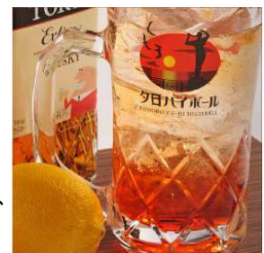
夕日ハイボール イメージ