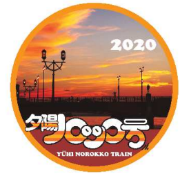
ヘッドマーク イメージ