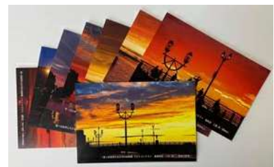
ポストカード イメージ