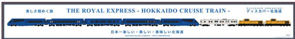
▲列車デザインイメージ©ドーンデザイン研究所

列車の動力となる機関車(JR北海道所有)は「北海道の力強く明るく元気な太陽の色・収穫の色」として「橙・オレンジ」を、列車内サービス用電力を供給する電源車(東急電鉄株式会社(以下、東急電鉄)所有)は『THE ROYAL EXPRESS』のロイヤルブルーとオレンジを粹につなぐ色」として「白・ホワイト」をメインカラーとし、北海道の自然豊かな緑の中を走る「THE ROYAL EXPRESS」のロイヤルブルーに橙、白が融合し、旅を楽しく美しく演出します。本列車の装飾は、「THE ROYAL EXPRESS」を手掛けた水戸岡鋭治氏がデザインします。