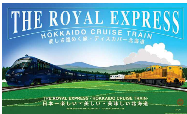
▲列車デザインイメージ©ドーンデザイン研究所(左) ／旅を彩る北海道の名所、大自然(イメージ)(右)