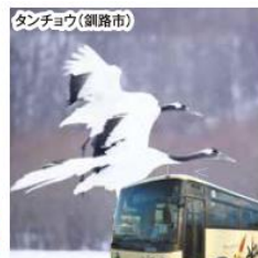
冬のたんちょう号