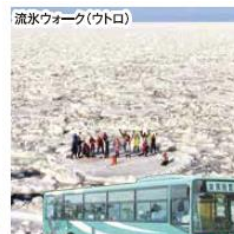
知床 エアポートライナー