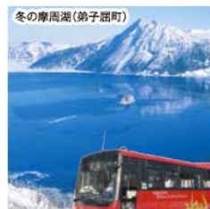
弟子屈 えこバスポート (期間限定バスを運行)