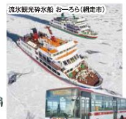
網走観光施設 めぐりバス