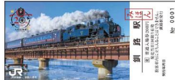
↑ 釧路駅記念入場券イメージ