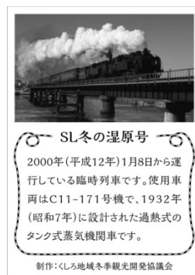
トレーディングカード裏面イメージ