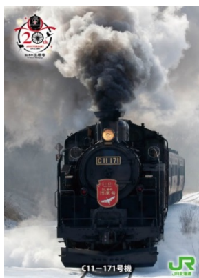
トレーディングカード表面イメージ