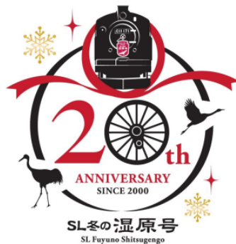
オリジナルロゴマークイメージ

運行開始 20 周年記念オリジナルロゴマークを作成し、各種宣伝物に掲出します。なお、ヘッドマークにつきましては、従来通りで運行します。